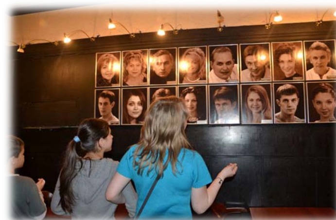
На спектакле в Камерном театре