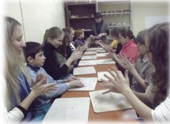
Сами изготавливаем окаменелости в краеведческом музее