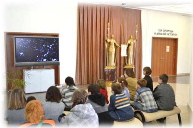
Экскурсия в планетарий