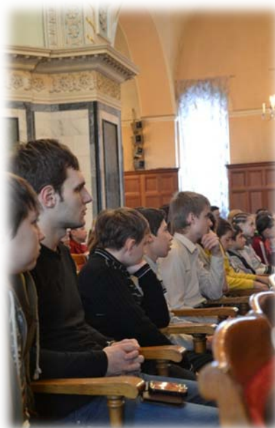
Концерт хоровой музыки в Органном зале