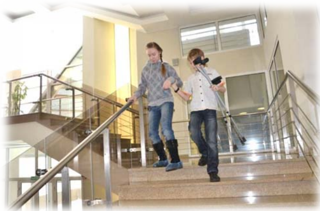
Представители обоих отделений