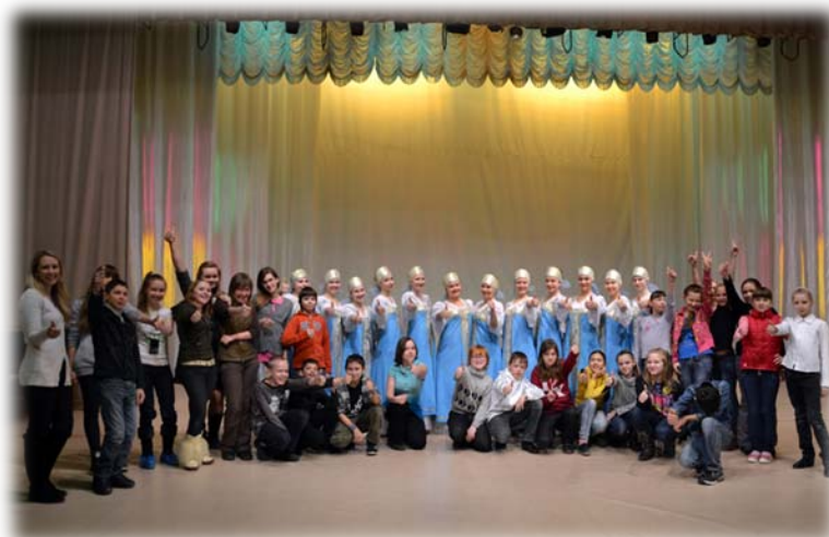
После хореографического концерта с ансамблем Барабушки