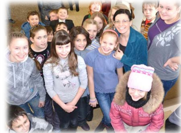
Первый воскресный выход